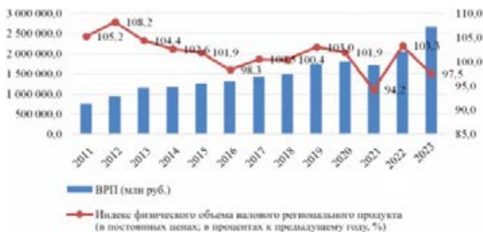
Рис. 2. Динамика ВРП Республики Башкортостан в 2011–2023 гг.

раза по сравнению с 2011 г. Отрицательная динамика индекса физического объема ВРП зафиксирована в 2021 г., очевидно, что на динамику показателей повлияла сложная эпидемиологическая ситуация, связанная с ковидом [8; 9].