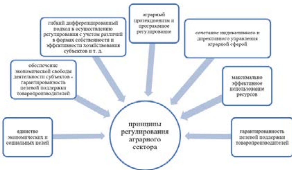
Рис. 2. Принципы государственного регулирования аграрного сектора

фермерские хозяйства; государство компенсирует им часть затрат на приобретение племенных животных, модернизацию материально-технической базы, оказывает помощь в уплате процентов по кредитам и финансирует инвестиционные проекты. Государственная поддержка оказывается всем отраслям сельского хозяйства, а также переработчикам сельскохозяйственной продукции. В настоящее время особое внимание уделяется развитию мясного скотоводства и традиционных для региона отраслей – овцеводства, коневодства и пчеловодства.